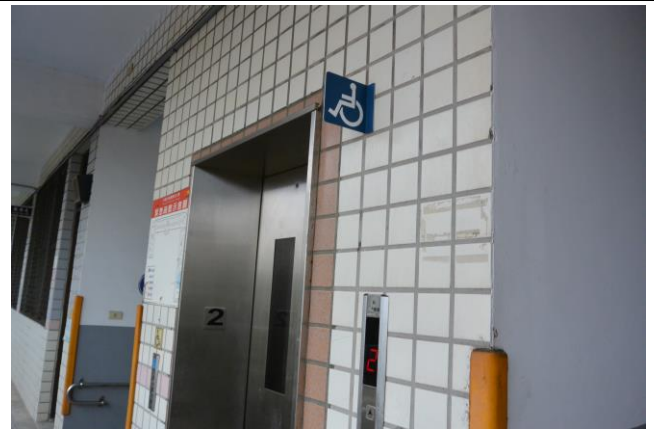
辦理日期：103 年 7 月-9 月 照片說明：電梯更新工程