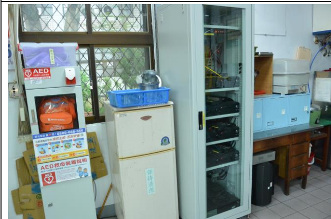
辦理日期：104 年 10 月-11 月 照片說明：監視主機