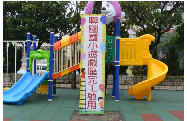
辦理日期：105 年 2 月 23 日 照片說明：遊戲區整修工程啟用