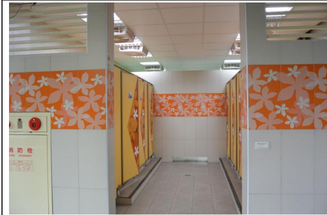
辦理日期：103 年 7 月-103 年 10 月 照片說明：老舊廁所整修工程（女廁）