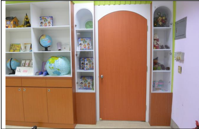
辦理日期：103 年 10 月 照片說明：新設門面及邊櫃