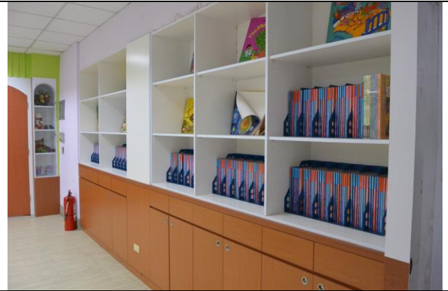
辦理日期：103 年 10 月 照片說明：設置英語圖書櫃