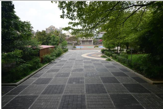
辦理日期：103 年 12 月 照片說明：校園中庭地坪整修工程