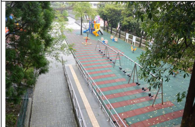
辦理日期：104 年 12 月-105 年 2 月 照片說明：遊戲區整修工程