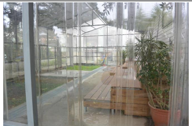
辦理日期：104 年 12 月-105 年 2 月 照片說明：遊戲區整修工程