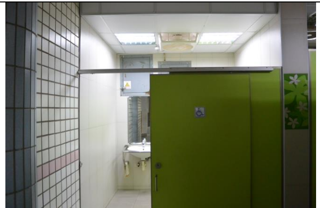
辦理日期：104 年 12 月-105 年 2 月 照片說明：新設身心障礙廁所工程