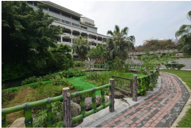
辦理日期：103 年 12 月 照片說明：校園中庭地坪整修工程