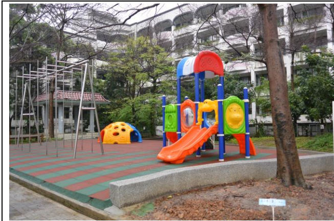
辦理日期：104 年 12 月-105 年 2 月 照片說明：遊戲區整修工程