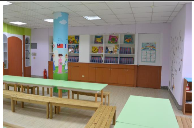
辦理日期：103 年 10 月 照片說明：柱面張貼各國服飾