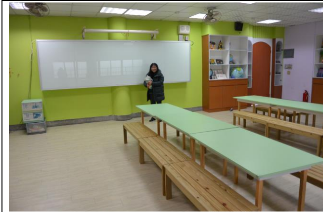
辦理日期：103 年 10 月 照片說明：學生桌椅及教學設備