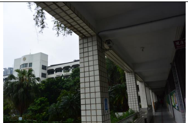
辦理日期：104 年 10 月-11 月 照片說明：走廊監視器設置