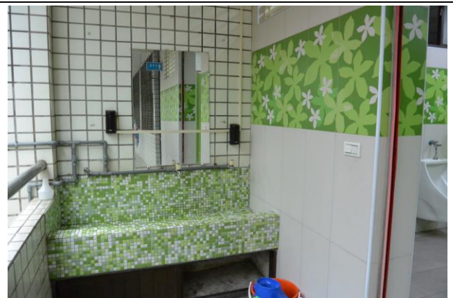
辦理日期：103 年 7 月-103 年 10 月 照片說明：洗手台改善工程