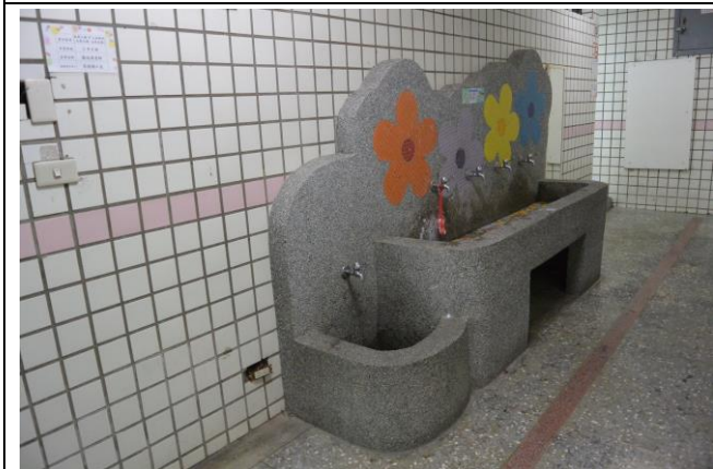
辦理日期：103 年 7 月-103 年 10 月 照片說明：新設洗手台工程