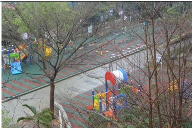
辦理日期：103 年 12 月 照片說明：校園中庭地坪整修工程