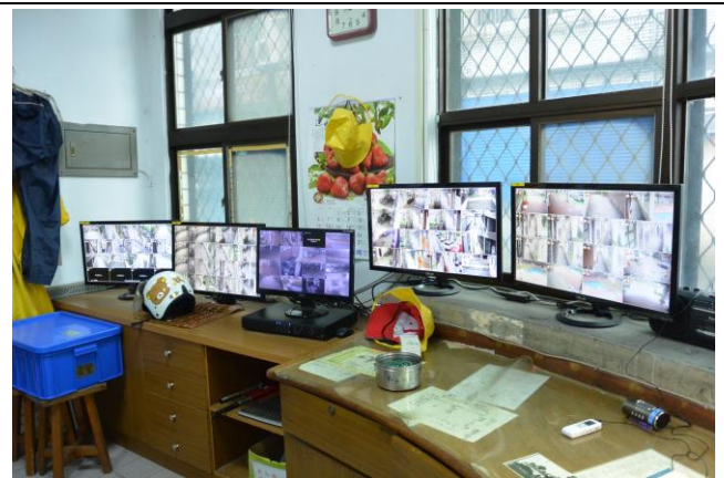
辦理日期：103 年 10 月 照片說明：監視器畫面（警衛室）