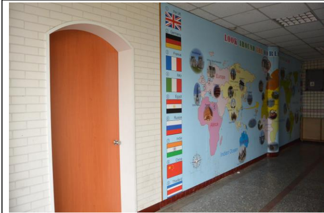
辦理日期：103 年 10 月 照片說明：英語情境教室入口世界地圖