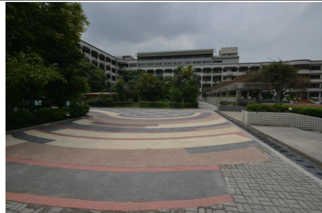
辦理日期：103 年 12 月 照片說明：校園中庭地坪整修工程