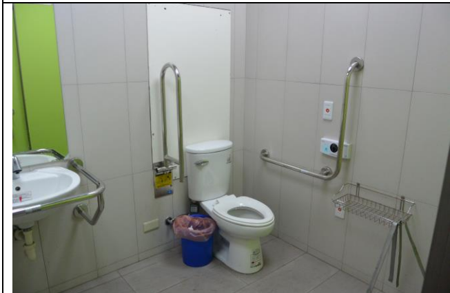
辦理日期：104 年 12 月-105 年 2 月 照片說明：新設身心障礙廁所工程