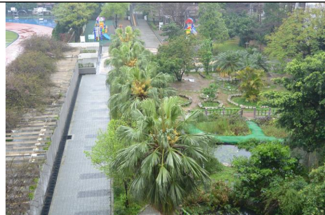
辦理日期：103 年 12 月 照片說明：校園中庭地坪整修工程