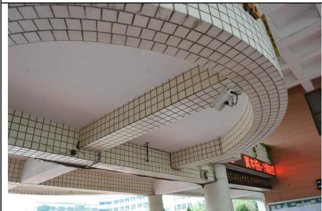
辦理日期：104 年 10 月-11 月 照片說明：操場監視器設置