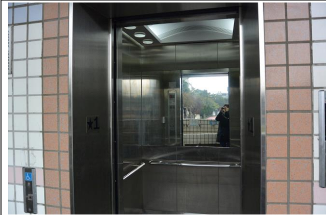
辦理日期：103 年 7 月-9 月 照片說明：電梯更新工程