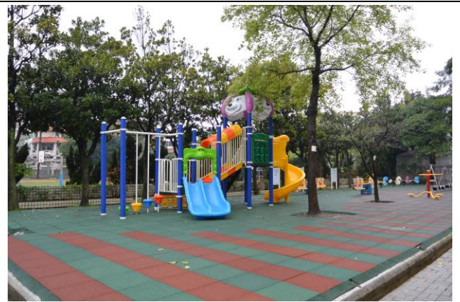
辦理日期：104 年 12 月-105 年 2 月 照片說明：遊戲區整修工程