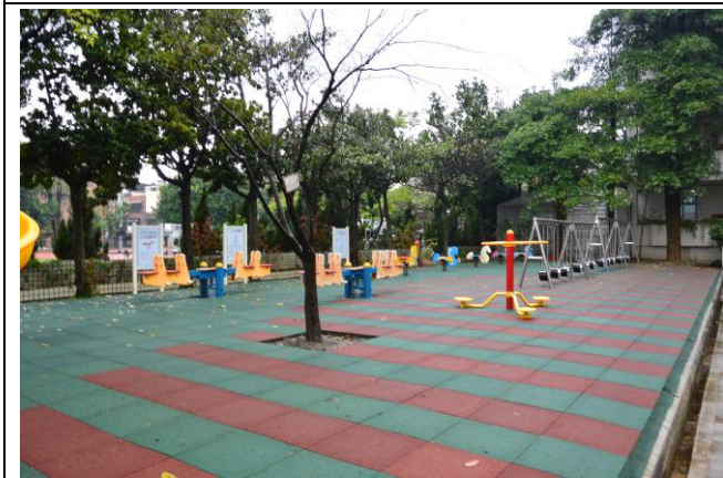
辦理日期：104 年 12 月-105 年 2 月 照片說明：遊戲區整修工程