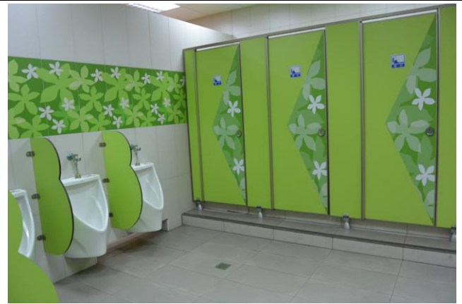
辦理日期：103 年 7 月-103 年 10 月 照片說明：老舊廁所整修工程（男廁）