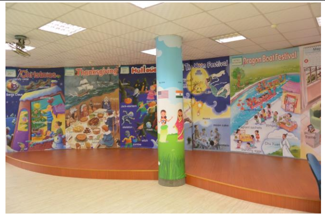
辦理日期：103 年 10 月 照片說明：展演舞台