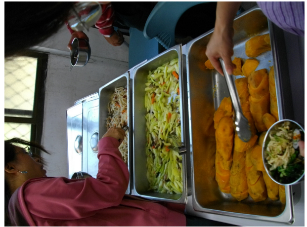
說明：低碳健康飲食料理 2