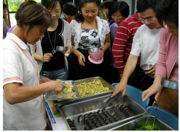
說明：低碳健康飲食料理品評 2