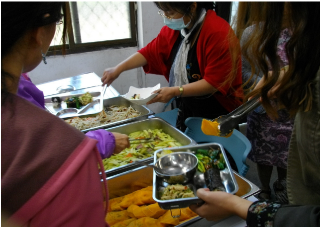
說明：低碳健康飲食料理品評 3