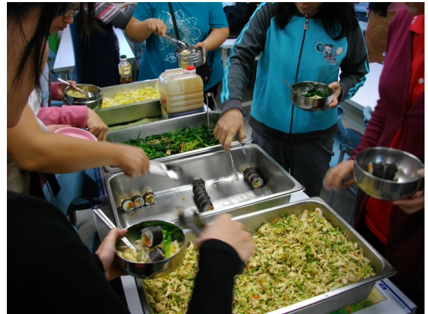
說明：低碳健康飲食料理品評 4