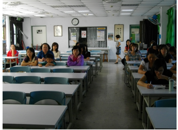
說明：研習學員專心聆聽 3