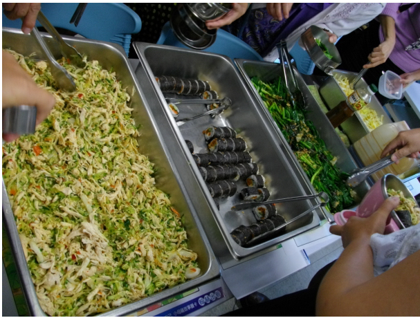
說明：低碳健康飲食料理 1