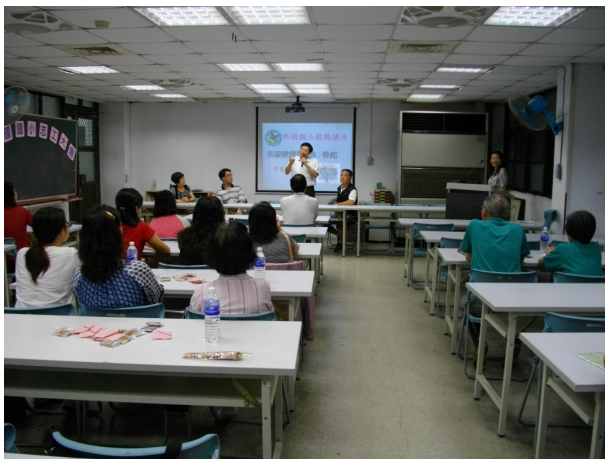
說明：低碳健康飲食親職講座校長開場介紹