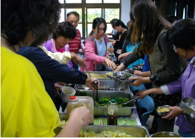
說明：低碳健康飲食料理品評 1