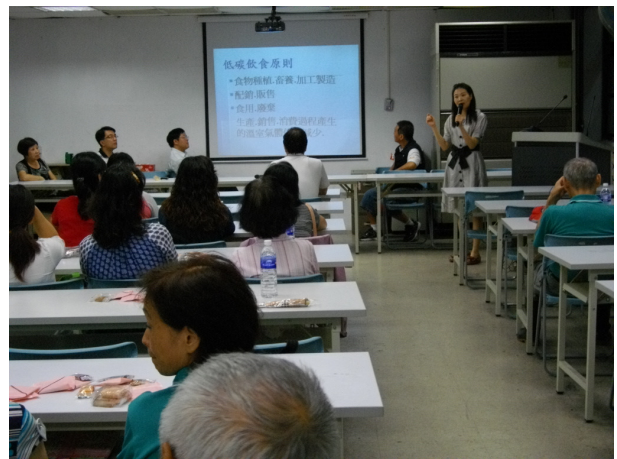
說明：低碳健康飲食親職講座課程說明