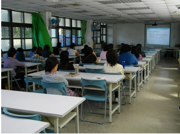
說明：研習學員專心聆聽 2