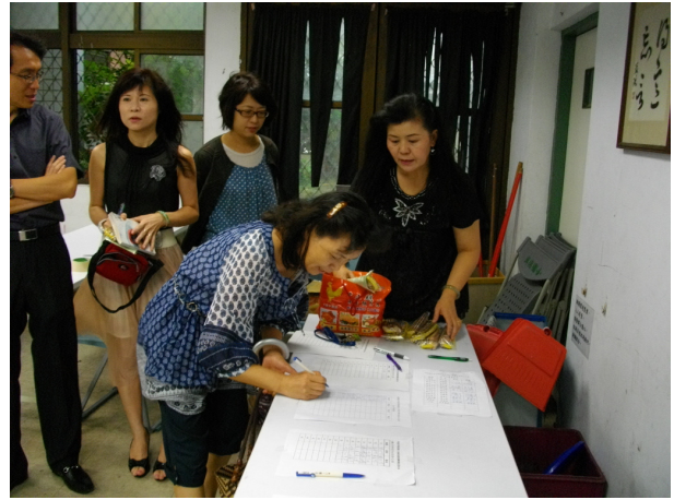
說明：：低碳健康飲食親職講座簽到