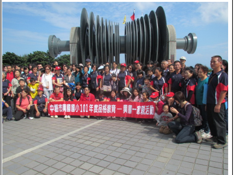
參觀核二廠展示館