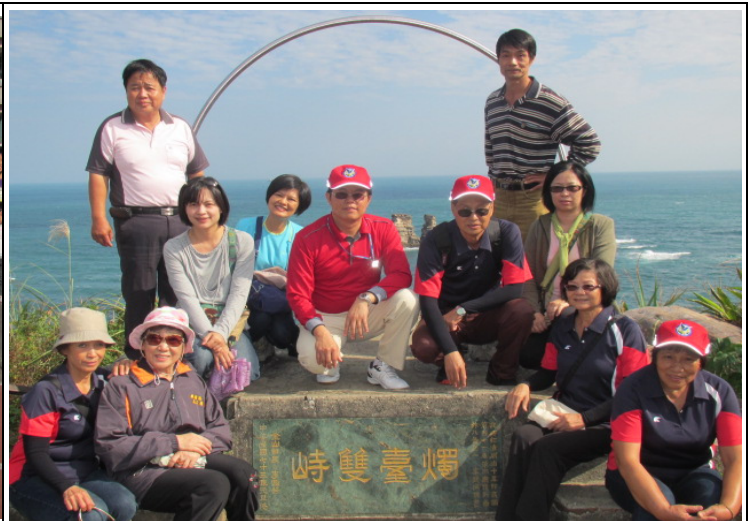
學校結合家長志工透過行動體驗增進愛護地球的觀念