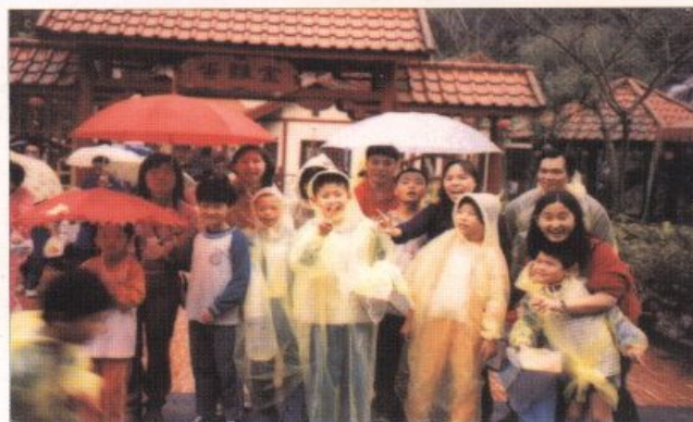
▲特教班小朋友校外教學，參觀金雞蛋農場