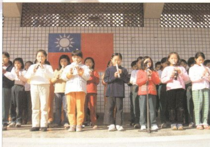
▲本校同學才藝表演，五年級小朋友的直笛吹奏