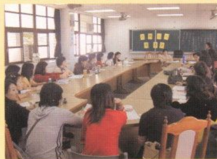
▲家長熱烈參與輔導義工活動