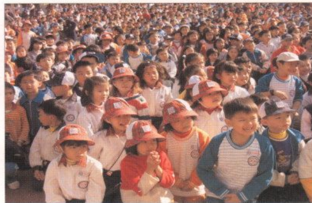
▲家長參與學校教學活動，校園魔術表演