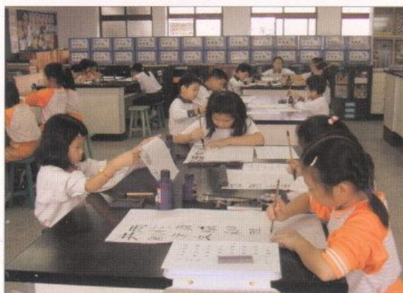
▲本校同學在溫馨的校園環境中快樂學習