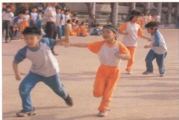
▲運動表演會，四年級小朋友的接力賽跑