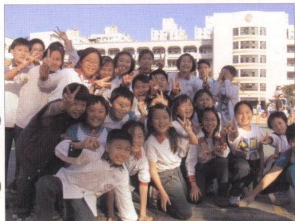
▲在興國的孩子們各個充滿歡樂，洋溢笑容