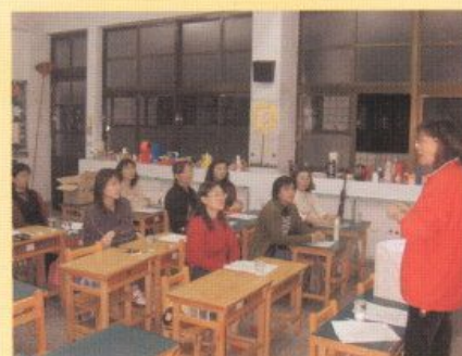
▲社區家長成長團體活動