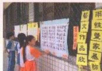
辦理生命教育與性別平等藝文競賽活動