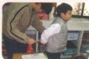
生命教育與身心障礙教育宣導體驗活動