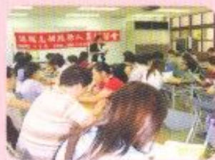
認輔志工培訓活動