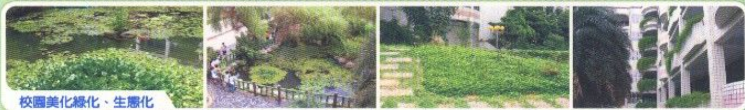
校園美化綠化、生態化