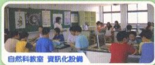
自然科教室 資訊化設備