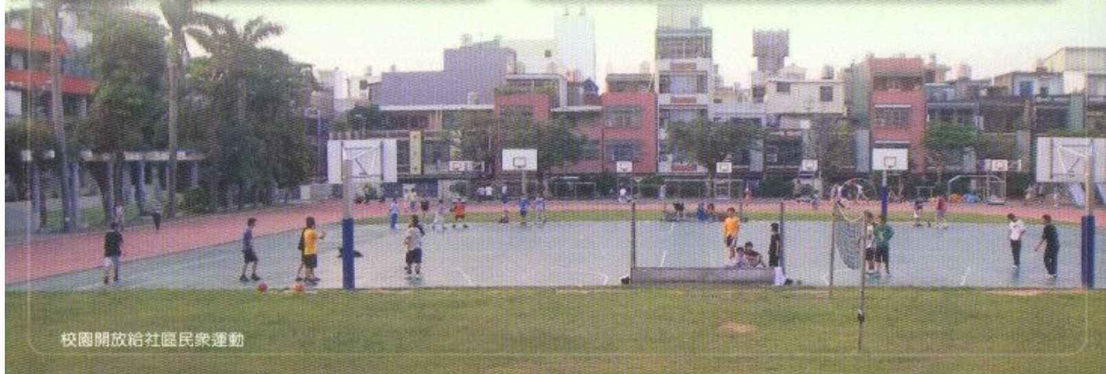
校園開放給社區民衆運動