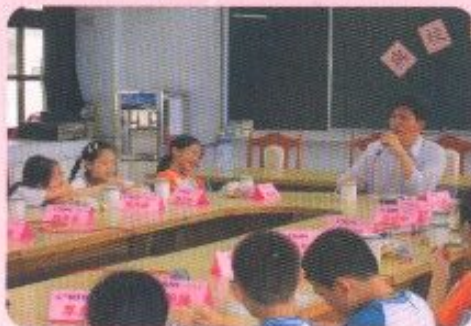
獲頒榮譽獎學生與校長茶敘

以發揮有教無類、因材施教理念為輔導的基石，透過各項輔導工作的推展，促進親師生的和諧，提升家長的親職知能；協助學童發展並探索其潛能，鼓勵學童的優良表現，解決適應的困擾。