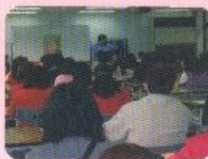
親職教育聘請專家演講活動