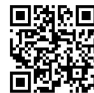
桃園市國民小學藝術才能音樂班 鑑定線上報名系統

*承辦學校西門國小網頁( https://www.simes.tyc.edu.tw/ )。