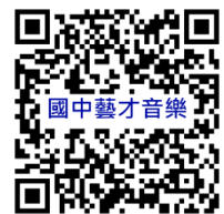
桃園市國民中學藝術才能音樂班 鑑定線上報名系統